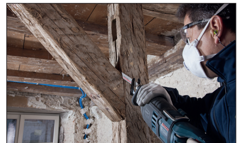
목재&철재용 프로그레시브 톱날은 외부에 고정된 프로파일을 손쉽게 절단 가능합니다.