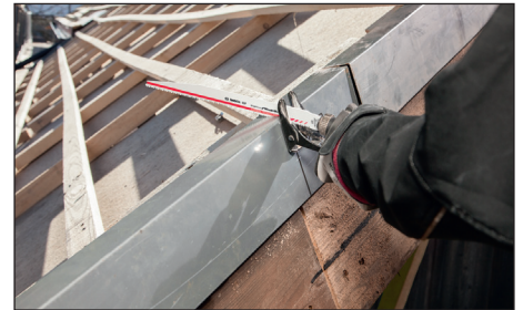
가장 긴 S 1256 XHM 제품은 큰 자재의 절단시 매우 편리합니다.