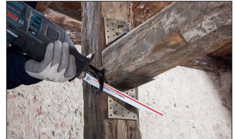
프로그레시브 톱니 형태로 금속 연결부위가 있는 목재 기둥의 편리한 절단이 가능